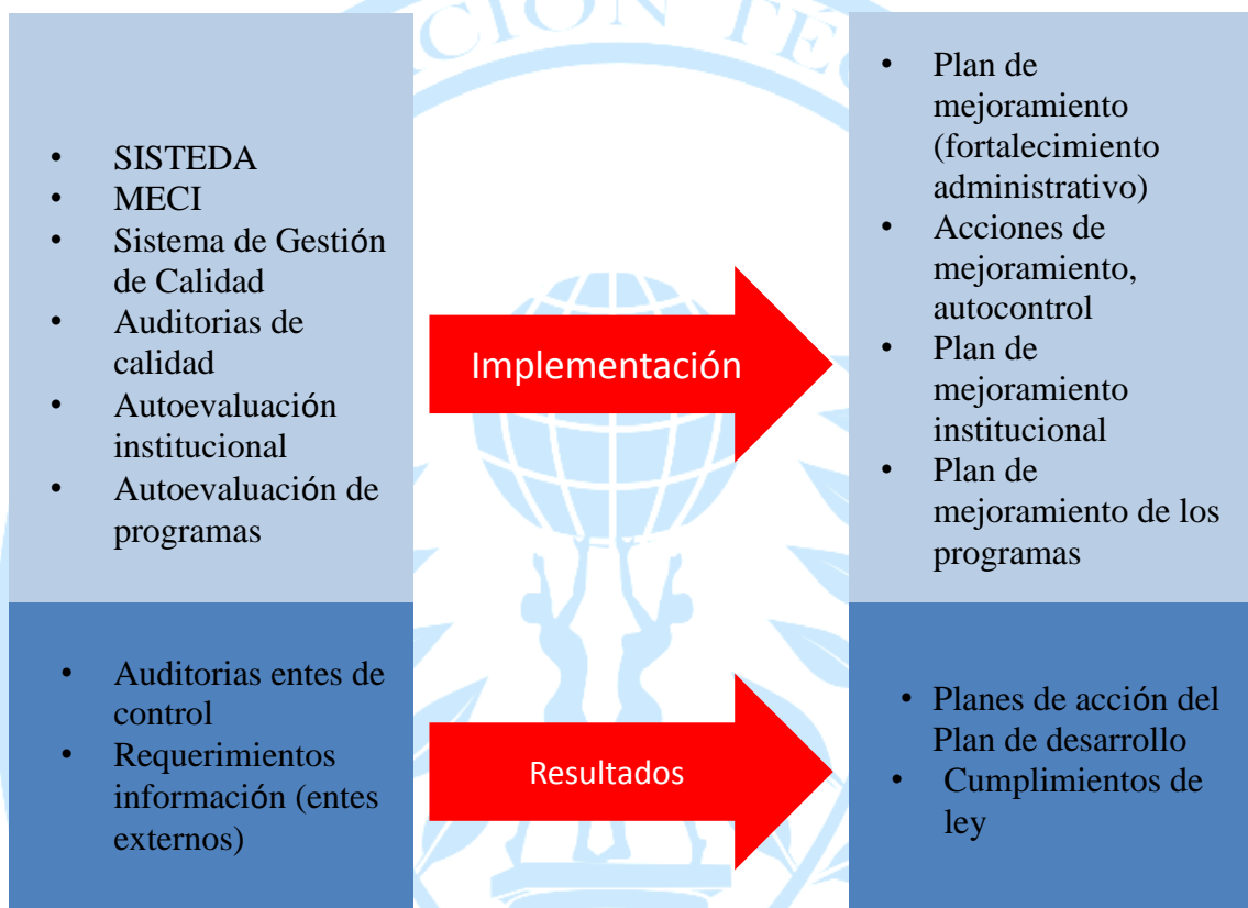
Gráfico 2. Referentes de Autoevaluación