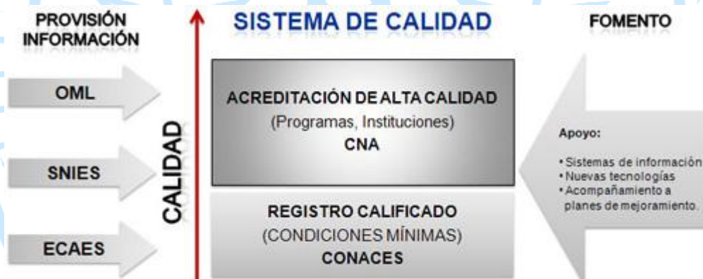
Gráfico 1. Sistema de Aseguramiento de la Calidad