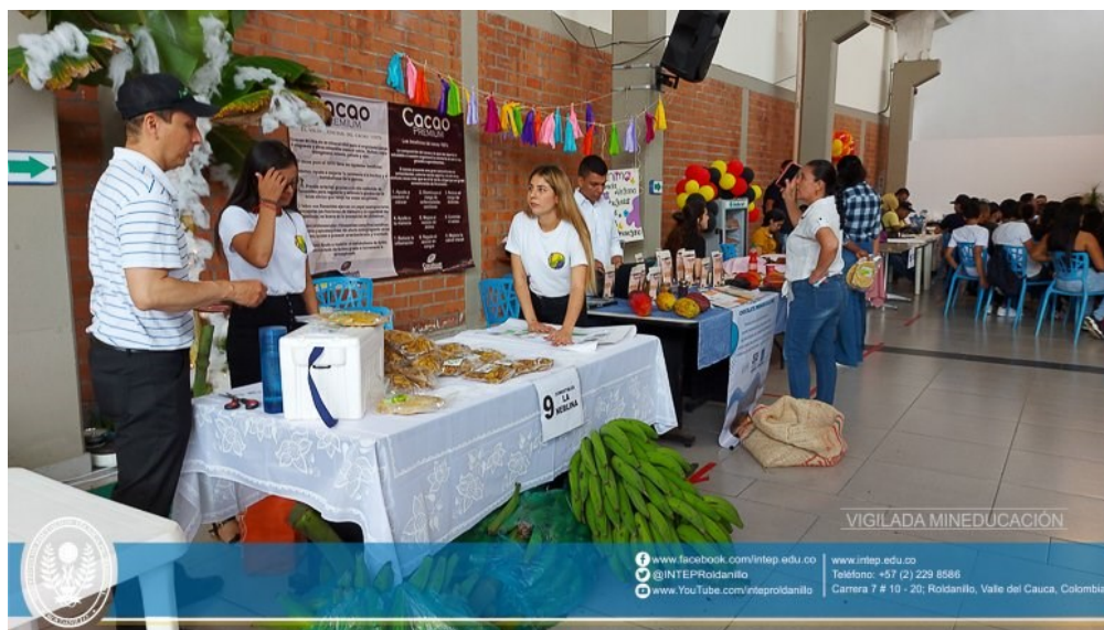
Foto tomada en la feria del emprendimiento EMPRENDEINTEP 2022.

Con esta información el estudiante adquiere herramientas, que le permiten disponerse como ser humano para enfrentar los retos que el desempeño profesional le exigirá en el mundo laboral, siendo consciente que el desempeño profesional lo puede ejercer en una empresa como empleado o gestionando su propia unidad de negocio.